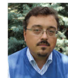
Автор проекта: архитектор Юрий Скороходов Производство клееного бруса: компания «ТАМАК» Строительство: компания «Индивидуальный дом»

БОЛЬШОЙ УЧАСТОК В СТАРОМ ДАЧНОМ ПОСЕЛКЕ ГОРКИ НЕПОДАЛЕКУ ОТ ПОДМОСКОВНОГО ГОРОДА КОРОЛЁВА, ПРИНАДЛЕЖАВШИЙ «СОВЕТСКОЙ АРИСТОКРАТИИ», БЫЛ РАЗДЕЛЕН НА НЕСКОЛЬКО ЧАСТЕЙ МЕЖДУ ПОТОМКАМИ ГЛАВЫ СЕМЬИ. НА ОДНОМ ИЗ ТАКИХ НАДЕЛОВ ТРЕБОВАЛОСЬ ВОЗВЕСТИ СОВРЕМЕННЫЙ УЮТНЫЙ ДОМ СО ВСЕМИ НЕОБХОДИМЫМИ ДЛЯ КОМФОРТНОЙ ЖИЗНИ ПОМЕЩЕНИЯМИ. ДЕФИЦИТ ТЕРРИТОРИИ И НЕОБХОДИМОСТЬ СОХРАНИТЬ РОСКОШНЫЕ ВЕКОВЫЕ СОСНЫ СТАЛИ ВЫЗОВОМ ДЛЯ АВТОРА ПРОЕКТА, НА КОТОРЫЙ ОН УСПЕШНО ОТВЕТИЛ. ДВУХЭТАЖНАЯ ПОСТРОЙКА ИЗ КЛЕЕНОГО ПРОФИЛИРОВАННОГО БРУСА ИЗ ДРЕВЕСИНЫ ЕЛИ НЕ ПРОИЗВОДИТ ВПЕЧАТЛЕНИЯ МИНИАТЮРНОЙ — В ПЕРВУЮ ОЧЕРЕДЬ БЛАГОДАРЯ СВОИМ ГАРМОНИЧНЫМ, ТОЧНО ВЫВЕРЕННЫМ ПРОПОРЦИЯМ. ЕЕ СДЕРЖАННАЯ КРАСОТА ОТВЕЧАЕТ ДУХУ И НАСТРОЕНИЮ МЕСТНОСТИ С БОГАТЫМ ИСТОРИЧЕСКИМ И КУЛЬТУРНЫМ НАСЛЕДИЕМ.